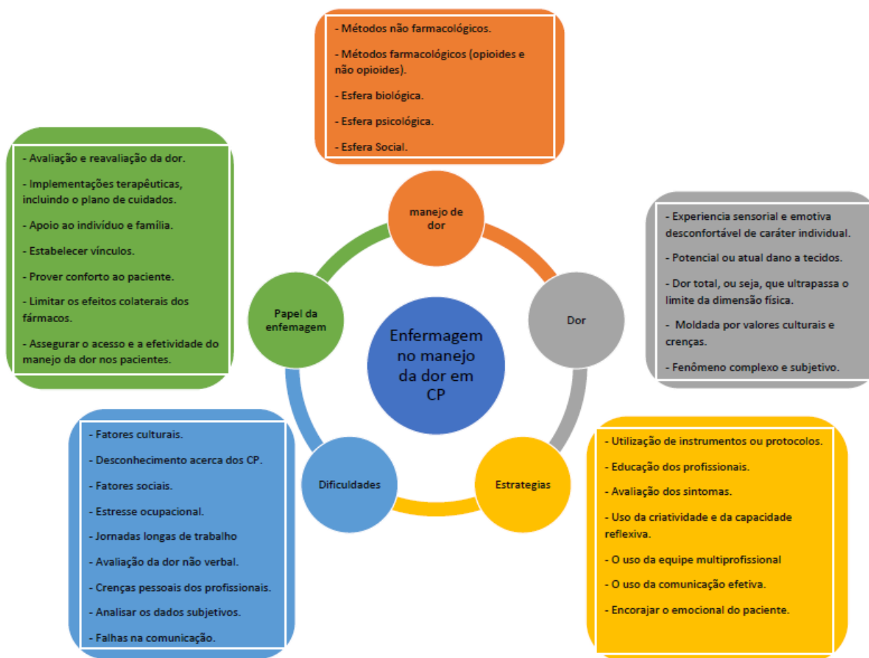
Figura 4: Matriz de Síntese dos artigos escolhidos.