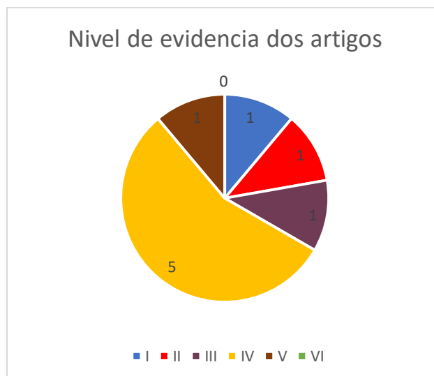
Figura 2: Nível de evidencia dos artigos selecionados.

Após a escolha dos artigos, os nove artigos incluídos foram classificados de acordo com os níveis de evidências, o que resultou em: